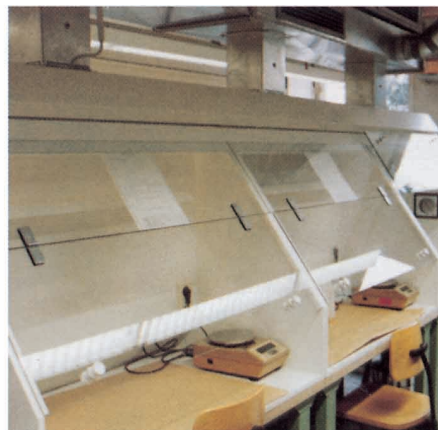
Abb. 2: Abgesaugte Gießharztische