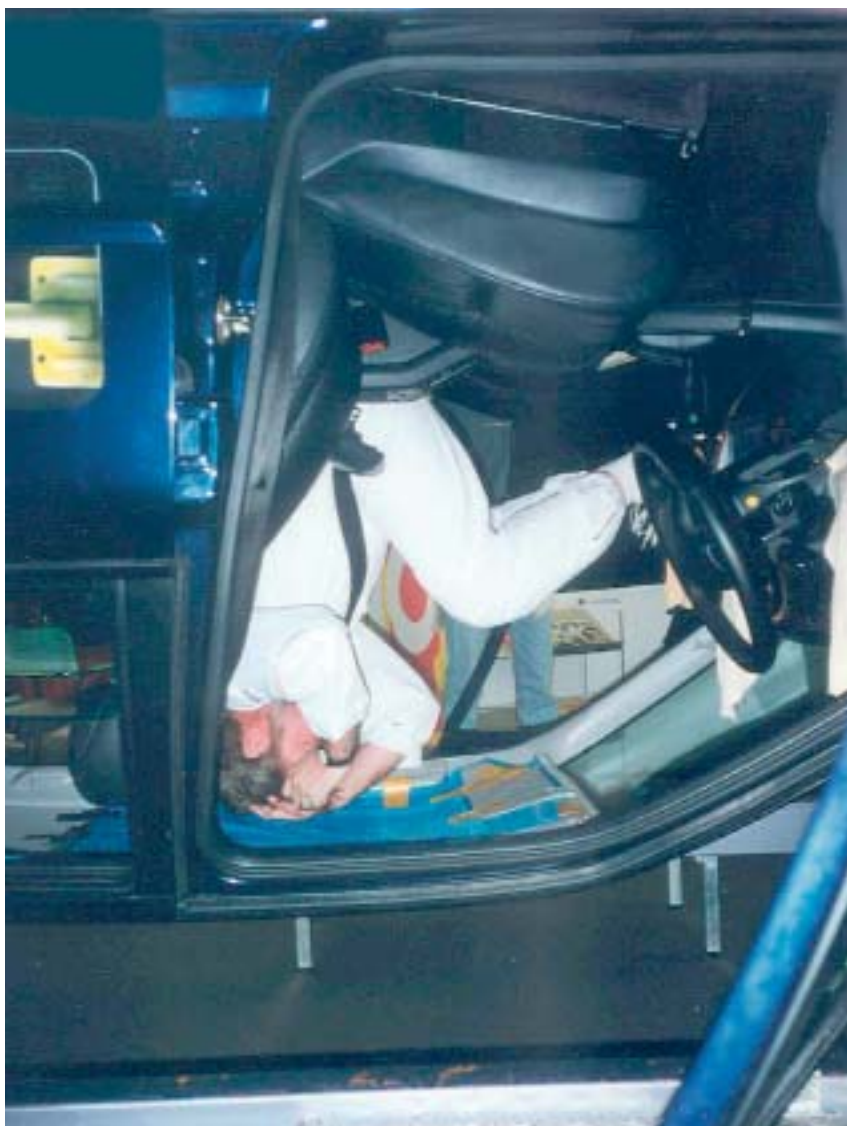
Im Fahr- und Unfall-Simulator steuert der Fahrer den PKW wie bei einem Computerspiel über eine Landstraße. Plötzlich kommt von rechts ein Geländewagen aus einem Waldweg. Vollbremsung, ausweichen - zu spät: Der Wagen bricht hinten aus, kommt von der Fahrbahn ab, überschlägt sich und bleibt auf dem Dach liegen.

An dieser Schulung beteiligten sich 576 der insgesamt 3.000 Mitarbeiter und Mitarbeiterinnen. Die Teilnahme war freiwillig und kostenfrei für die Mitarbeiter, das Unternehmen bezahlte die ausgefallene Arbeitszeit.