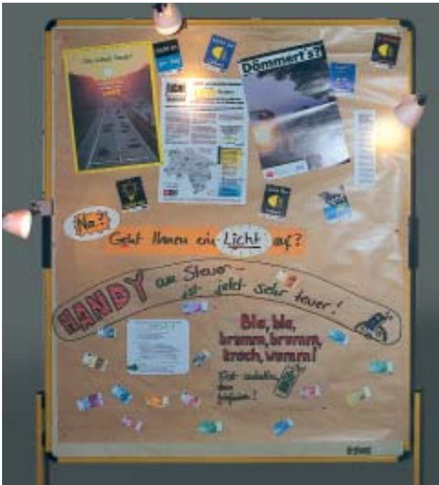
Die Mischung macht's: Denkanstöße informativ, witzig und provokant verpackt.

Mit Plakaten und Faltpblättern visualisierten die drei jungen Sicherheitsbeauftragten unter der Frage „Na? Geht Ihnen ein Licht auf?“ das Pro und Contra des Fahrens mit Abblendlicht auch am Tage.