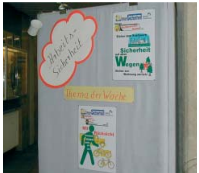
Die Auszubildenden stellen ihr Thema auf einer Pinwand in den Kantinen vor.