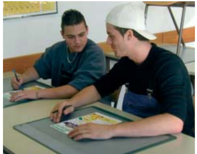
Team-Arbeit hilft auch beim Ausfüllen der Arbeitsblätter.