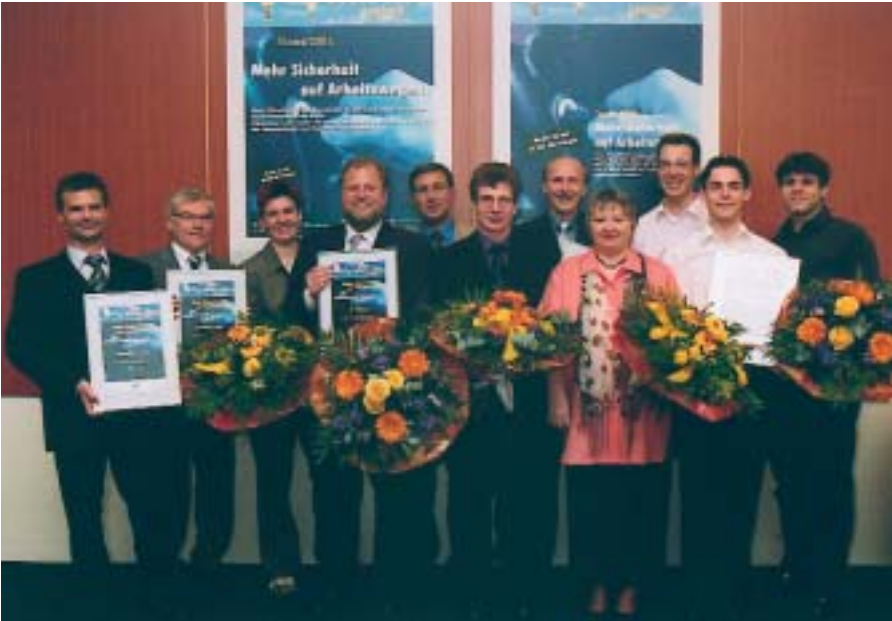
Die Gewinner und Gewinnerinnen des Ideenwettbewerbs

Ich bin sicher, dass Ihre Ideen auch andere Betriebe davon überzeugen können, dass es möglich ist, die Verkehrssicherheit in die Maßnahmen zum Arbeits- und Gesundheitsschutz mit einzubeziehen.