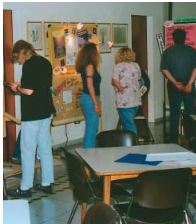
Zum Nachtsicht Sicherheit: Die Ausstellung war direkt neben der Kantine.

profilierte Sohle eines Sicherheitsschuhs dazu gelegt. Informationen über empfohlene Profiltiefen im Sommer und im Winter und über gesetzlich vorgeschriebene Mindestprofile ergänzten diese interessante „Lernstation“.