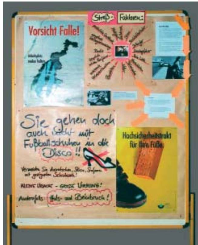
Gehen mit Grips erspart Dir den Gips: Gekonnte Werbung für sicheres Schuhwerk und Beachtung von Stolperfallen.

Besonders viel Beachtung fand die Schaufensterpuppe mit Krücke: Rechter Fuß mit Sicherheitsschuh, linker Fuß im Gipsverband.