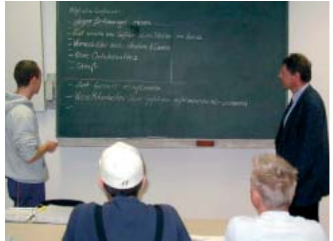
Die Gruppe diskutiert Gefahren und erarbeitet Sicherheitsmaßnahmen.

Wenn das Thema durchgearbeitet ist, kann jeder sein Wissen noch einmal in einen Prüfbogen einbringen. Diese Bögen kommen in eine Verlosung von kleinen „Motivationshilfen“ wie Parkscheiben und Kaffeetassen.