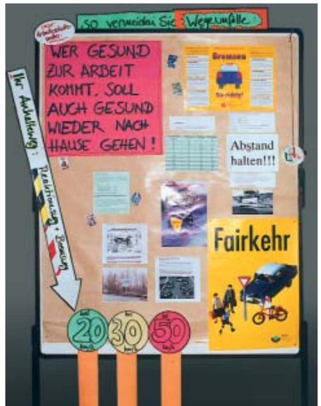
Abstandsregeln und Bremsweg kennen: Verständlich dargestellt mit Postern, Tabellen und lustigen Sprüchen.

Dass kaum einer den Unterschied zwischen Bremsweg und Anhalteweg kennt, hatten die „Macher“ der Ausstellung in Gesprächen mit Kollegen herausgefunden. Da der Anhalteweg die Summe aus Reaktionsweg und Bremsweg ist, markierten sie für die Geschwindigkeiten 20, 30 und 50 km/h den Reaktionsweg gelb-schwarz und den Bremsweg rot-weiß. Nach 16 Metern endeten zwei der Streifen „krawumm“ in einem Aufprall mit Hinweisen wie „Bei 50 km/h enden Sie hier immer noch mit einer Aufprall-Geschwindigkeit von ca. 47 km/h“. Auf der Pinwand am Ausgangspunkt hängen eine Schablone zum Ablesen von Anhaltewegen für Geschwindigkei-