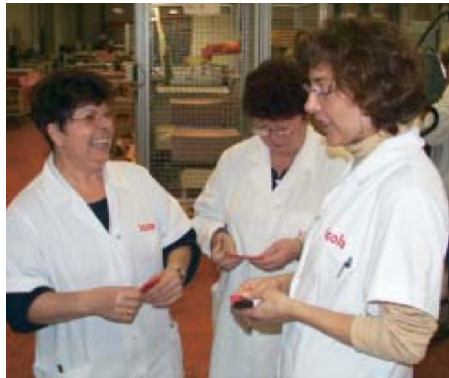
Nach dem Kurzgespräch am Arbeitsplatz zum Thema „Profil zeigen“ gab's einen Reifenprofil-Messer.

Die Mitarbeiter-Zeitung berichtete über die Aktion „Nimm Dir ZEIT und nicht das LEBEN“ und zog eine positive Bilanz.