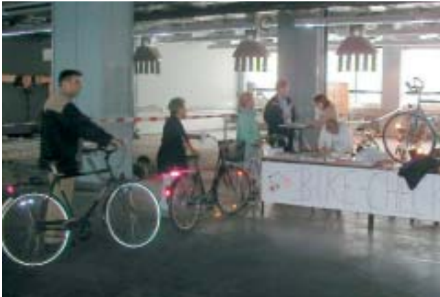
Kostenloser Fahrrad-Check für alle Mitarbeiter reduzierte Radunfälle um 50 Prozent.

Unfälle mit dem Rad enden oft mit schweren Körperschäden oder sogar tödlich. Außer dem umsichtigen Verhalten des Radfahrers ist der einwandfreie technische Zustand des Rades Grundvoraussetzung für die sichere Fahrt mit dem Rad. Die Jury prämierte deshalb zwei Betriebe mit je einem Sonderpreis von 2.557 Euro, die ihren Mitarbeitern eine kostenlose technische Untersuchung der Fahrräder angeboten haben.