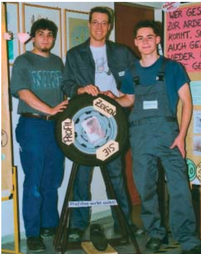
Drei Auszubildende gestalteten eine stark beachtete Ausstellung zur Verkehrssicherheit und gewannen den 1. Preis.