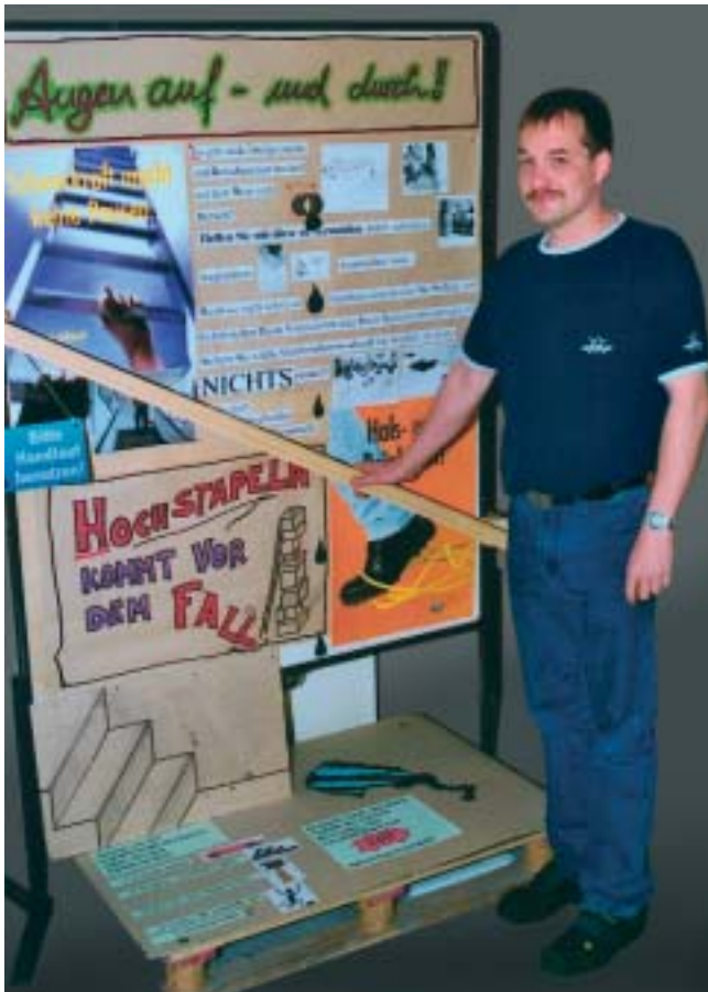
Der Handlauf: Sicherheit zum Anfassen.

Handlauf benutzen“, zum Thema Ordnung und Sauberkeit am Arbeitsplatz das BGFE-Plakat „Hals- und Beinbruch“ und zu den Gefahren des Treppensteigens das Plakat „Schwerkraft macht keine Pausen“. Auf dem Podest unter der Stellwand waren die zum Thema gehörenden Unfallstatistiken dargestellt – aufgelockert mit passenden Bildern.